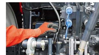
■ミッションオイル点検