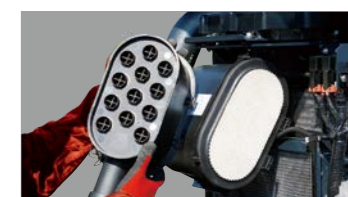
■エアクリーナ点検