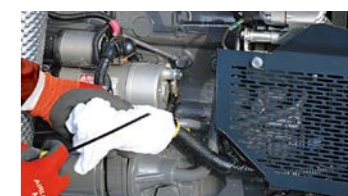
■エンジンオイル点検