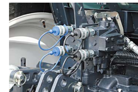
※写真は WD 型