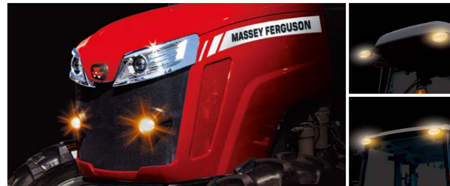
●4灯プロジェクト式ヘッドライト

トラクタ前方・後方を明るく照らし、夜間の作業も安心して行えます。 ※路上走行中、キャビン作業灯は必ず消灯してください。