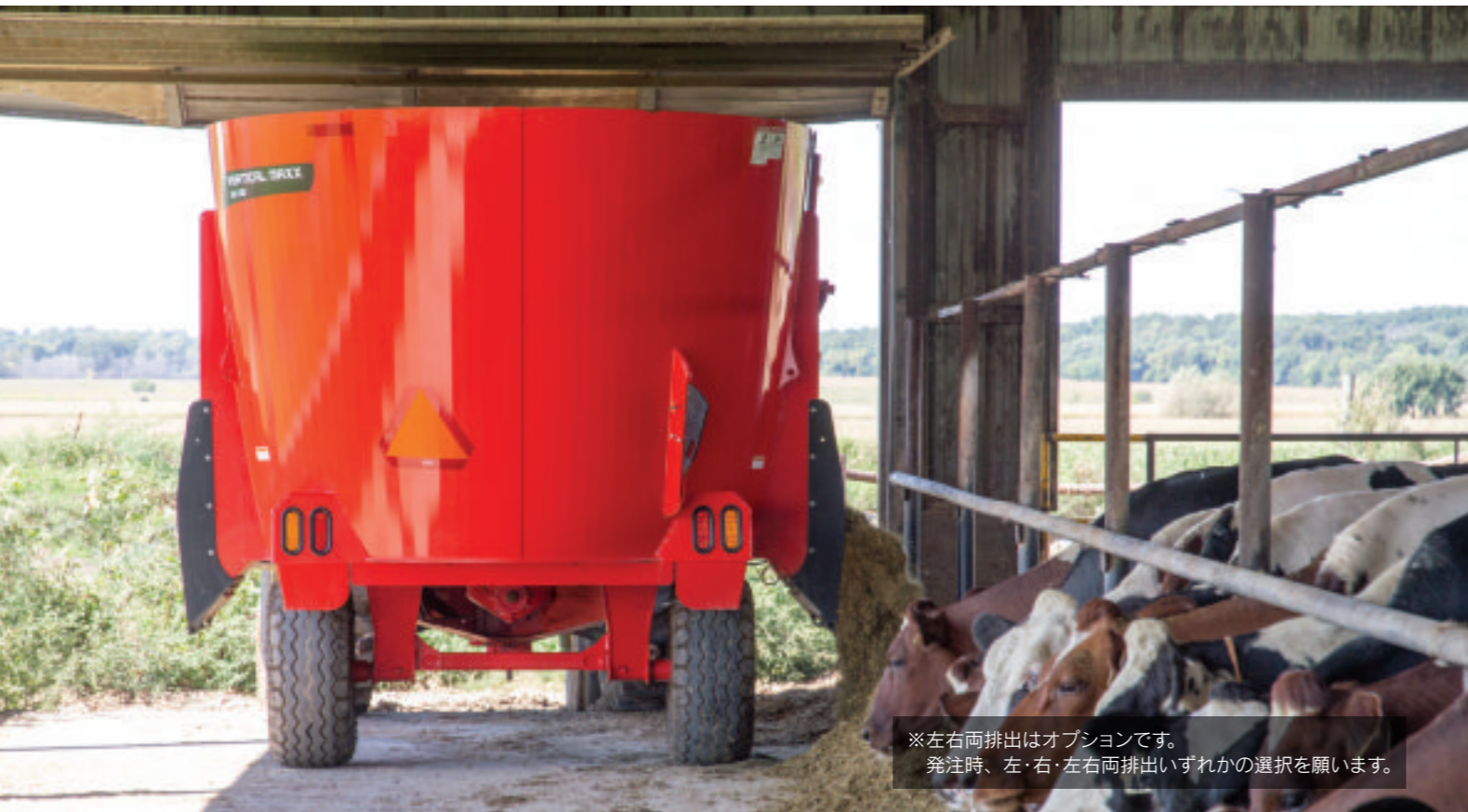
※左右両排出はオプションです。 発注時、左・右・左右両排出いずれかの選択を願います。