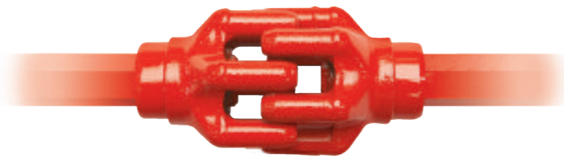
表面硬化鍛造された鋼製！

デジドライブの誕生から約 20 年が過ぎ、現在では 15 万台以上のクーン テッターが最高の信頼を得ながら世界中で活躍しています。