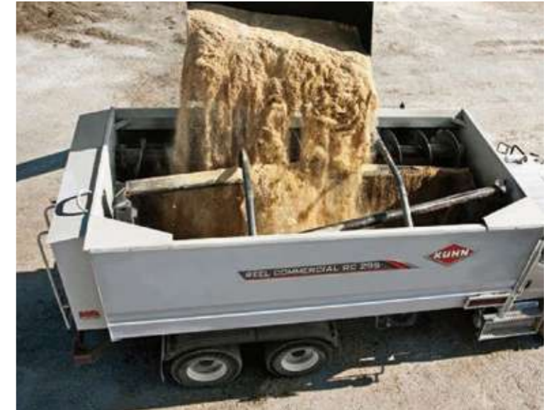
※写真は海外仕様であり一部日本仕様とは異なります。

クーンの RC200 シリーズリールコマーシャルミキサーは、革新的な装備品により、非常に優れた耐久性と性能を発揮します。オープンセンター設計のヘリックスリールが飼料を素早く均質に攪拌します。改良されたリール設計が水分を含む粕類等の副産物配合率が多い飼料でも最適な攪拌を行います。ヘビーデューティドライブは作業条件が厳しい中でも耐久性を発揮し、本機の寿命を延ばし、重量のある飼料の攪拌も可能にします。汎用性の高さで低所要馬力を兼ね備えたこれらの特長がリールとオーガー設計の性能を最大限に高めます。トラクターけん引式、トラック搭載式、定置式から攪拌容量 14.2 ~ 26.9m 3 から選択でき、あらゆる作業体系に合った 1 台をお選び頂けます。