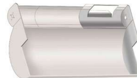
※イラストは部分的ステンレスライナーです。