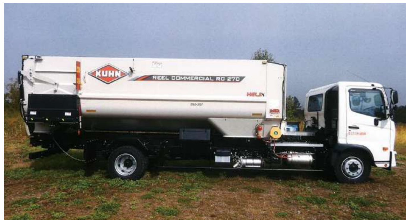
※トラック搭載仕様は公道走行できません。

クーンのトラック搭載ミキサーは、日本国内に流通するトラックに搭載可能で、お客様のニーズや搭載するトラックにマッチしたミキサーをお届けします。