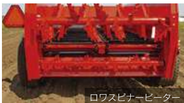
ロウスピナーピーター

※オプション、装備につきましては、予告なく仕様やサイズが変更になる場合があります。