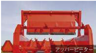
アッパーピーター